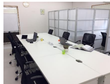
テレワークセンター

入退去管理システムの導入:サテライトオフィス及びテレワークセンターのテレワーカーのテレワークセンターの利用について、テレワークセンターの管理者を常勤させることなく、入退去をシステムで管理することによりセキュリティと手軽な利用を両立した。また、システムによりテレワークセンターを利用する際のテレワーク環境の情報等(Wi-FiのSSID、PW等)をセキュアなシステムで共有しました。